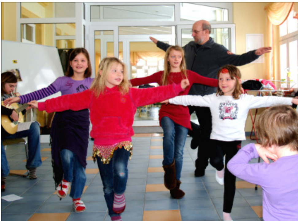
Familienrüste 2010 in Thiessow - Aufführung des Musicals "Zirkus genial".

wer war ohnmächtig? Alle Welt sollte es auf dem Schädelberg sehen: