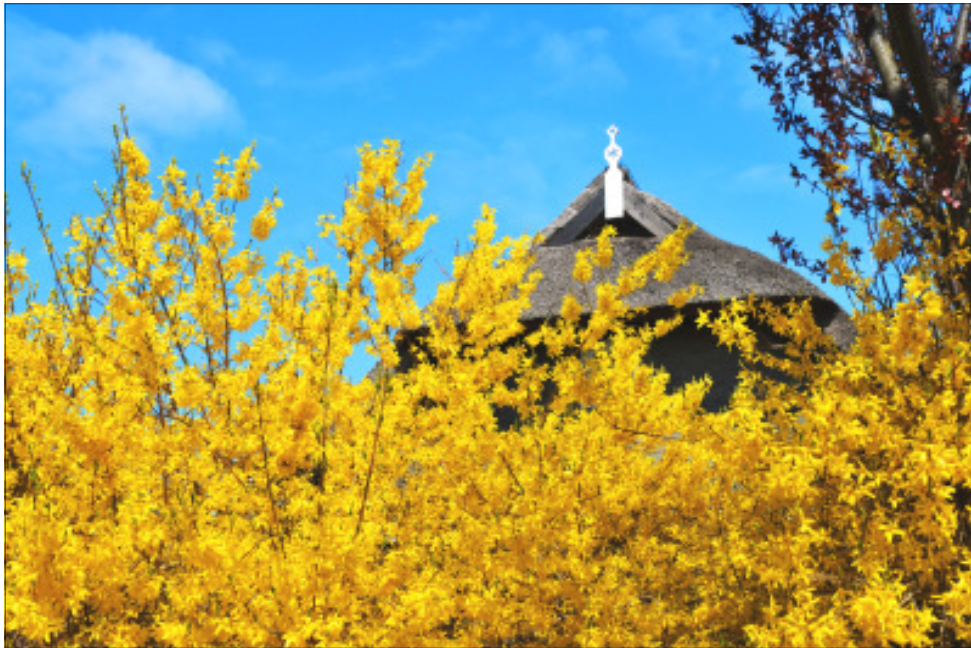
Frühling an der Ostsee